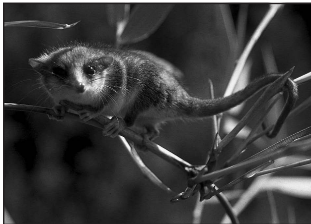
Figura 1. Ejemplar de monito del monte registrado en los bosques de Nahuelbuta (fotografía: Jaime E. Jiménez, 1984).

recursos naturales, los que deben abastecer a una población cada vez más numerosa y que demanda más bienes y servicios ambientales (por ejemplo, alimentos, agua limpia, espacio). La masiva modificación del uso del suelo para diversas actividades productivas ha llevado a una crisis de la biodiversidad (Sala et al. 2000), de la cual los científicos y las autoridades han pasado a formar parte activa en los últimos 20 años. Actividades humanas como la ganadería extensiva o la expansión de la frontera agrícola han llevado a la pérdida, fragmentación y degradación de los hábitats naturales, comprometiendo la persistencia, a largo plazo,